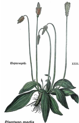
Plantago media von Leonhart Fuchs (1543)

Früher war die Gattung Plantago der Familie Ehrenpreisgewächse (Veronicaceae) zugeordnet, heute stellt man sie zusammen mit dem ehemals namensgebenden Ehrenpreis ( Veronica sp.) in die Familie Wegerichgewächse (Plantaginaceae), die etwa 275 Arten umfasst. Hierzu gehören u. a. so bekannte Arten wie Fingerhut ( Digitalis sp.), Löwenmaul ( Antirrhinum sp.) oder Wasserstern ( Callitriche sp.).